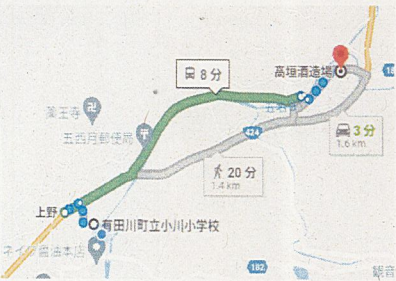
小川小学校から徒歩20分